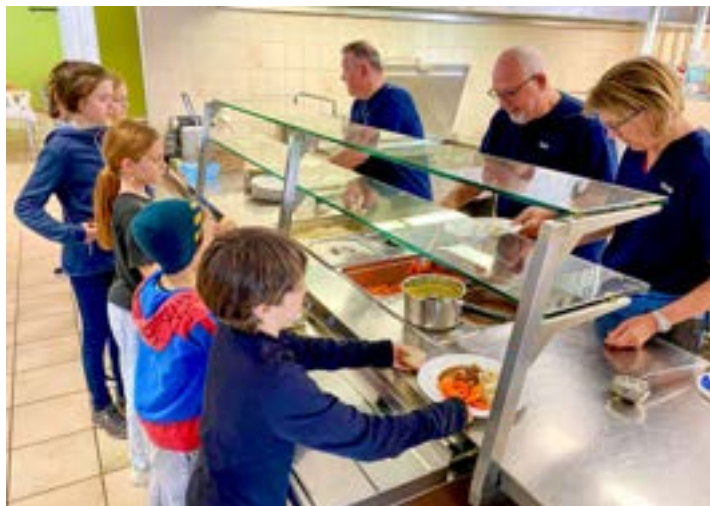
Feines Mittagessen vom JK Schlossbrünneli Möriken.