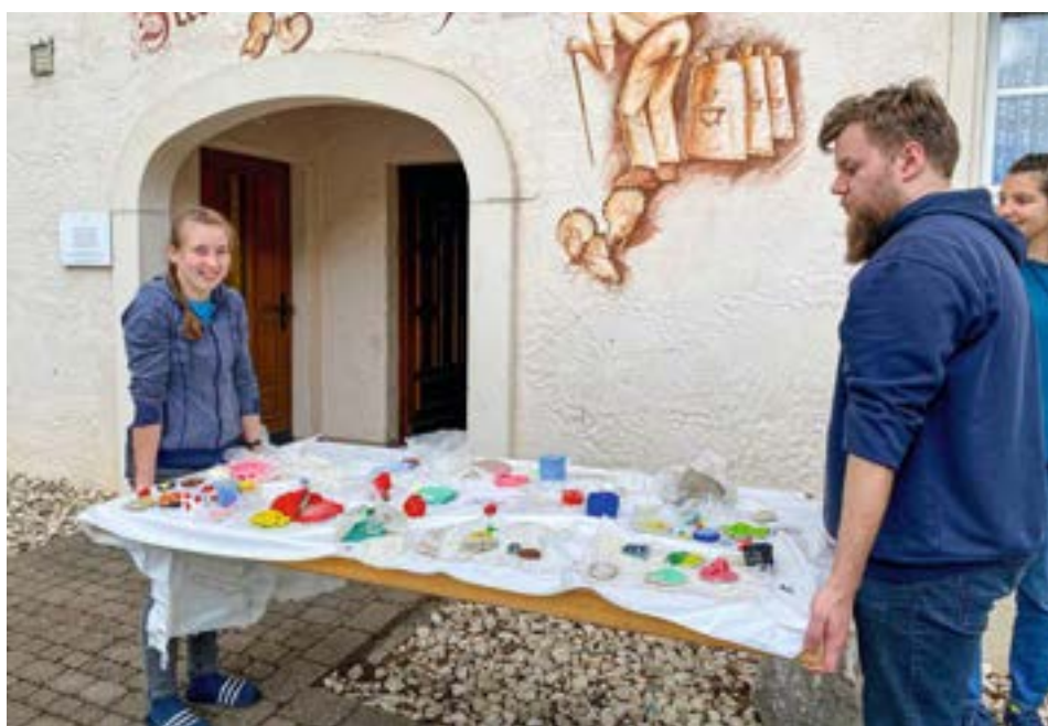
Basteln und Werken.